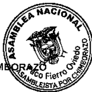
Paco Fierro Oviedo ASAMBLEÍSTA POR CHIMBORAZO