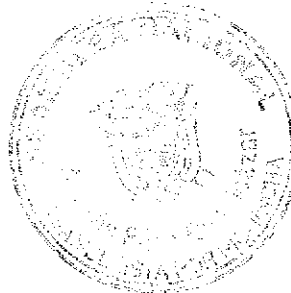
Dr. Andrés Páez Benalcázar ASAMBLEISTA POR PICHINCHA ID.