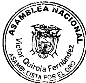
Víctor Quirola Fernández ASAMBLEÍSTA POR LA PROVINCIA DE EL ORO